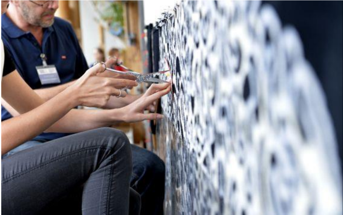
Manufacture de la Savonnerie

在日フランス大使館／アンスティチュ・フランセ日本は、モビリエ・ナショナル—フランス国営動産管理局と協働し、日本のデザイナーのためのデザイン賞を開催します。受賞者は副賞として、フランスで一ヶ月間、デザインのプロジェクトに向けたリサーチのためのレジデンスを行う権利を得ます。受賞者は滞在中に、モビリエ・ナショナルやそのコレクションや工房を発見し、受賞プロジェクトの実現のためにモビリエ・ナショナルからの専門的なサポートを受けます。工房の見学や、現地のデザイナーや職人、彼らのサヴォアフェール（匠の技）との出会いを通して理解・交流を深めることができます。