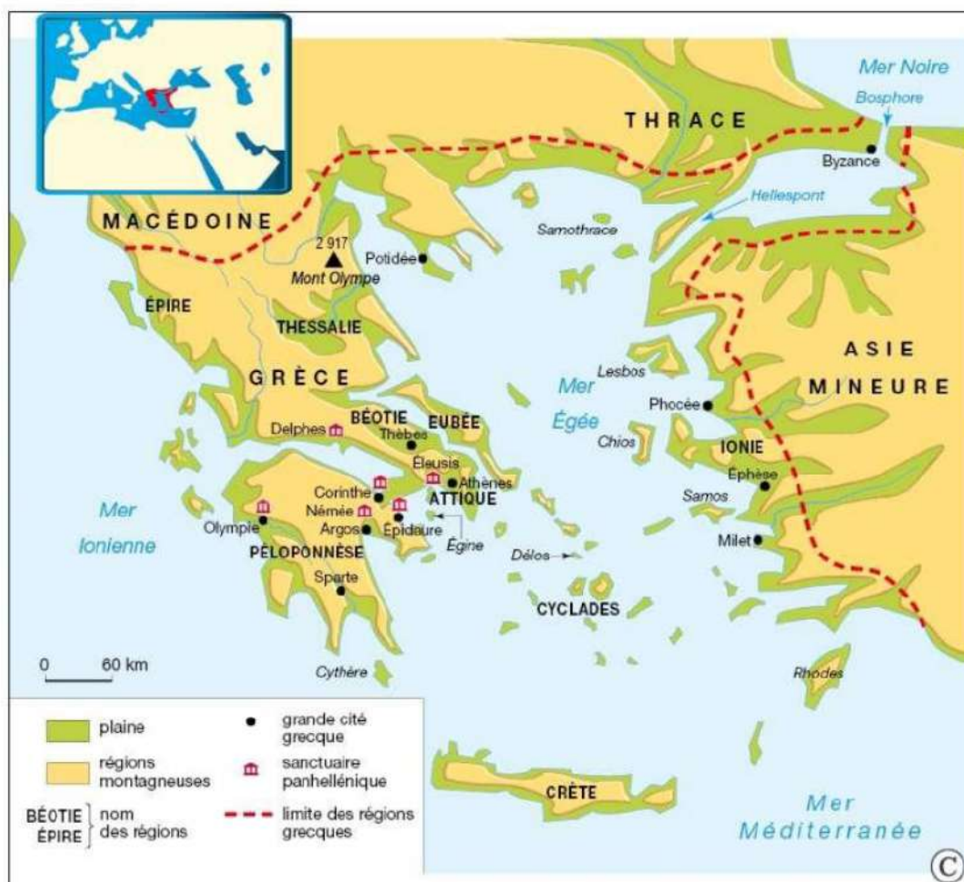
Le monde panhellénique antique - les citées grecques

15. Quelles sont les 2 "ombres" évoquées par Guy Boyer à la fin du texte ?