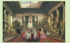
Charles Giraud: Salle à manger de la princesse Mathilde