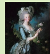
エリザベト・ヴィジエール・ブラン (バラを持つマリー・アントワネット)

8月27日(火)19:00-20:30 大輪のバラが咲き誇るロココ時代の庭園と室内 講師 遠藤浩子 フランス在住 庭園文化研究家 小柳由紀子 美術史家 料金 ¥1,000