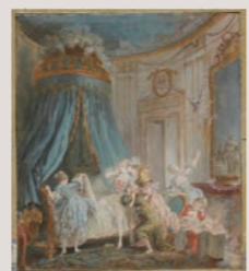
ピエール・アントワーヌ・ボードワン(花嫁の床入り)

アール・ド・ヴィーヴルが開花した18世紀フランスの住居とインテリアの歴史について、多くの画像とともに解説します。