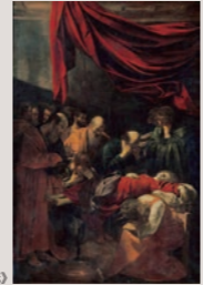
カラヴァッジョ(聖母の死)

バロックの奇才が、水死した娼婦や市井の人々を聖母や聖人のモデルとして描きこんだ、宗教画について観ていきます。