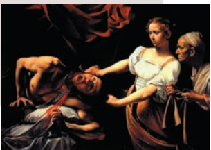
(ユディットとホロフェルネス)

1月31日(土)、2月7日(土)、14日(土)13:00-14:00 カラヴァッジョ 講師 小柳由紀子 美術史家 料金 クラブ・フランス会員 ¥7,000(3回) 一般¥7,500(3回)