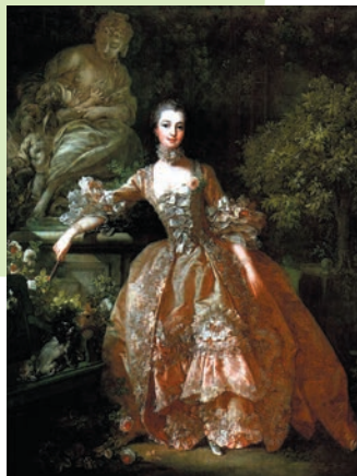
《ポンパドゥール夫人の肖像》フランソワ・ブーシェ

2月20日(金)19:00-20:00 華麗なるトレンドセッター、ポンパトゥール夫人：魅惑の18世紀アール・ド・ヴィーヴル 講師 遠藤浩子 庭園文化研究家 小柳由紀子 美術史家 料金 ¥1,500