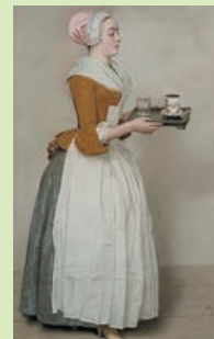
ジャン・エチエンヌ・リオガール (シヨコを運ぶ娘)

※メインディッシュ付きランチbuffet込み。 13時以降もごゆっくりお楽しみいただけます。 ※お申込み締め切り:2月6日(木) 会場 西鉄グランドホテル グランカフェ